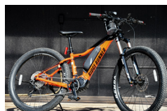
E-マウンテンバイク

Eバイクはスポーツバイクの走行性能と電動自転車のアシスト機能をかけ合わせた自転車です。スポーツバイクのようにスピードを出して軽快な走りを楽しみつつ、坂道や長距離ライドでは電動アシストでラクに走り抜けることができます。